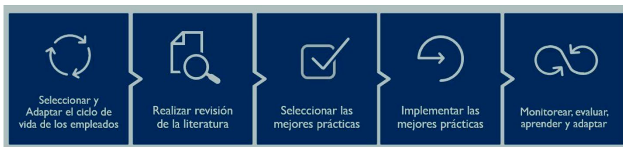
FIGURA 3. Metodología para la elaboración del marco de buenas prácticas

La metodología empleada para desarrollar este marco (representada en la figura 3 a continuación) incluyó la identificación y adaptación del ciclo de vida del empleado, una revisión bibliográfica, la selección de las mejores prácticas y herramientas, y la implementación de una selección de esas mejores prácticas con las contrapartes de Engendering Industries.