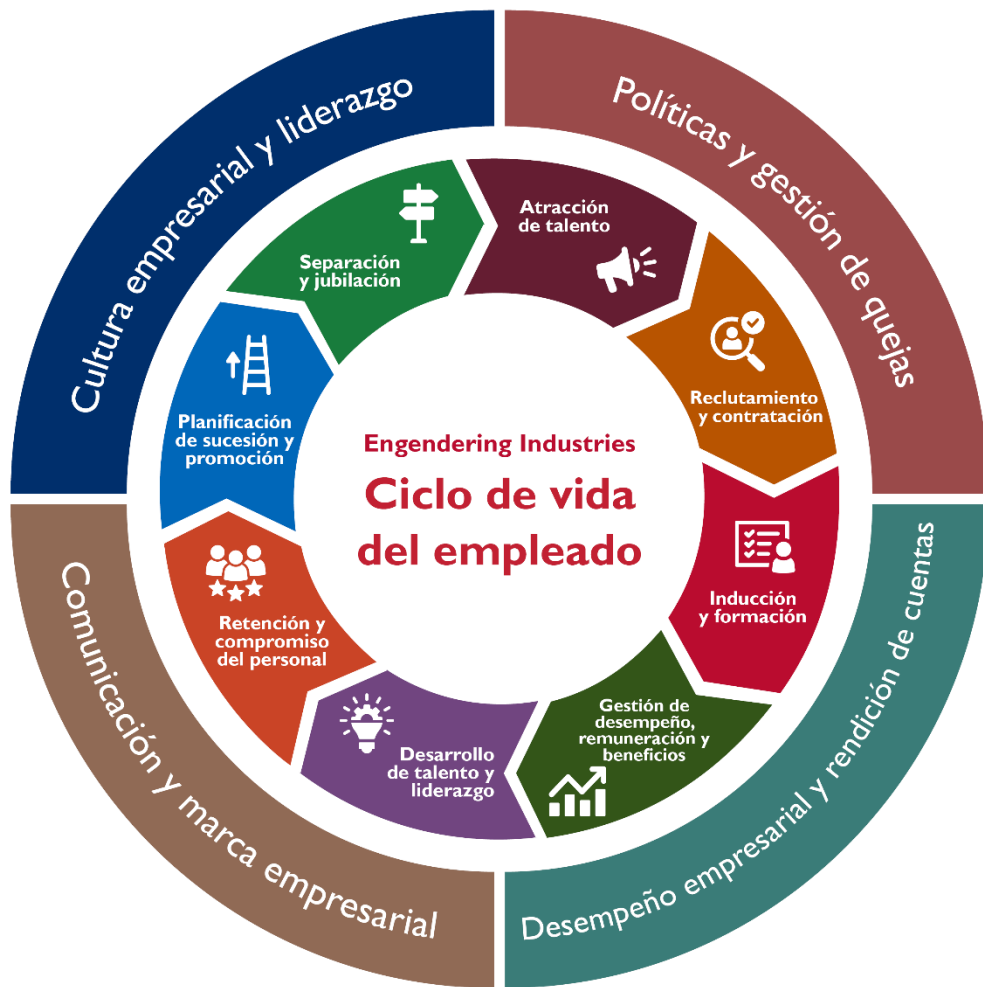
FIGURA 4. Ciclo de vida del empleado

Aunque el ciclo de vida del empleado se centra explícitamente en una organización específica y en su personal, también es importante reconocer el contexto social y sectorial en el que opera una organización. Este contexto influye en las normas, creencias y prácticas de las organizaciones que permean la cultura del lugar de trabajo y, por tanto, es fundamental que el liderazgo de las organizaciones lo comprendan al implementar las mejores prácticas. Este contexto está formado por el marco jurídico y político nacional, las normas y valores regionales de género, el entorno económico y el atractivo del mercado, la calidad del sistema educativo, los servicios y las infraestructuras que permiten la participación de la fuerza laboral, así como las organizaciones de monitoreo y regulación. Asimismo, los lugares de trabajo también pueden influir en el contexto social y sectorial. Por lo tanto, aunque este marco se centra en el ciclo de vida del empleado y en los facilitadores organizativos y no aborda explícitamente este contexto más amplio, se alienta a las organizaciones a que comprendan el contexto social y sectorial a la hora de implementar las mejores prácticas.