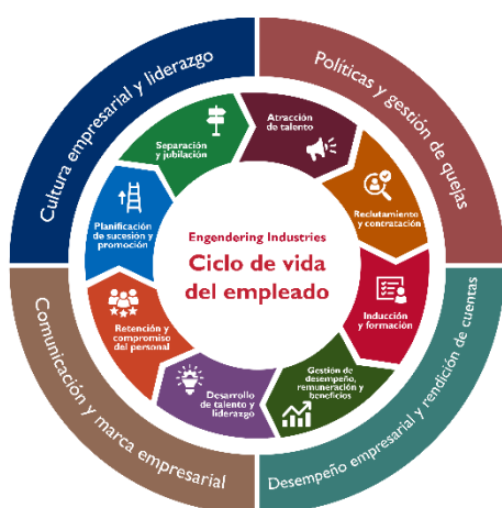
FIGURA I: Ciclo de vida del empleado

A pesar de las pruebas que demuestran el valor de la mujer en la fuerza laboral, las mujeres continúan enfrentándose a barreras estructurales para participar en la economía mundial, sobre todo en las industrias tradicionalmente dominadas por los hombres. A nivel mundial, la tasa de participación de las mujeres en la fuerza laboral es un 25% inferior a la de los hombres. 2 Como promedio, las mujeres trabajan menos horas por un salario o beneficio, ya sea porque optan por trabajar a tiempo parcial o porque el trabajo a tiempo parcial es su única opción disponible. En algunos países, las brechas de género en los salarios por hora para trabajos parecidos pueden alcanzar el 20%. 3 Según el Foro Económico Mundial (FEM), con las tendencias actuales, la brecha global de género tardará 135,6 años en cerrarse. 4